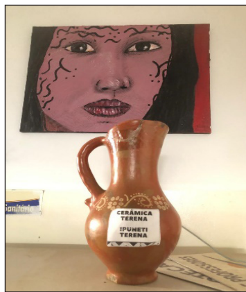
Figura 4 – Desenho e cerâmica Terena