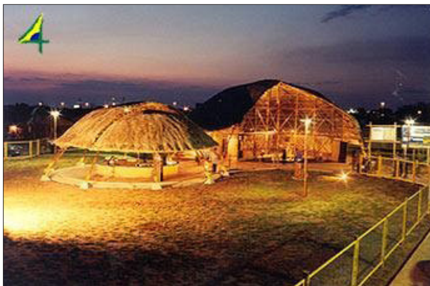
Figura 2 – Vista parcial do Memorial da Cultura Indígena da Aldeia Urbana Marçal de Souza