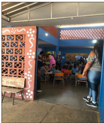
Figura 3 – Escola Tumoné Kalívono

Os professores de Educação Física participam do processo de valorização cultural, com a inclusão de jogos indígenas, como cabo de força, peteca, jogo da onça, lançamento de tora, cama de gato e outros. Em sala de aula, os alunos aprendem o alfabeto Terena, com pronúncia, cores, números, frutas, cumprimentos, lendas, mitos, ritos, tanto das etnias indígenas do estado de Mato Grosso do Sul como das de outros estados da federação.