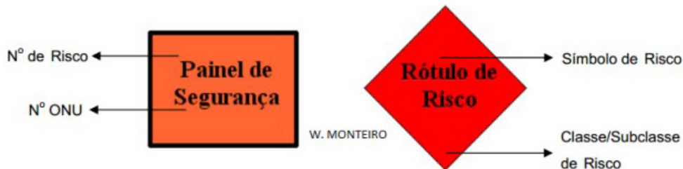
Figura 1 – Identificação através do painel de segurança pela ONU