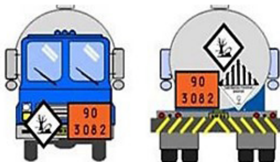
Figura 3 – Localização correta das rotulagens e dos painéis no modal rodoviário